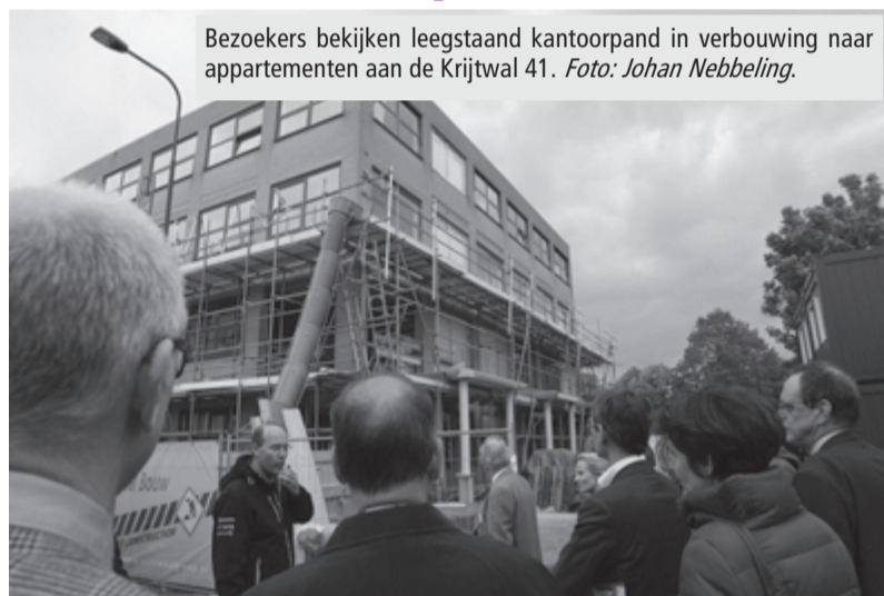
Bezoekers bekijken leegstaand kantoorpand in verbouwing naar appartementen aan de Krijtwal 41.