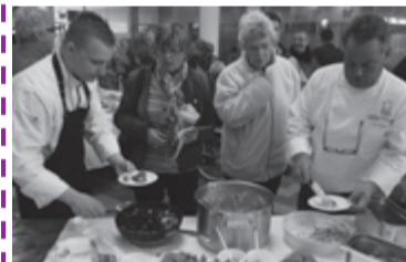
Proefroute in de binnenstad.

Zondag stond Nieuwegein in het teken van duurzaamheid. Kijk voor meer informatie en een (foto)verslag op www.nieuwegein.nl/duurzamedag .