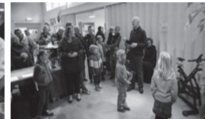
Opening Energiefiets in het Natuurkwartier.